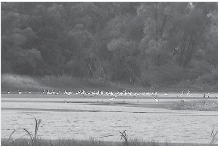
Великі білі чаплі на о. Круглик. 17.09.2001 р.