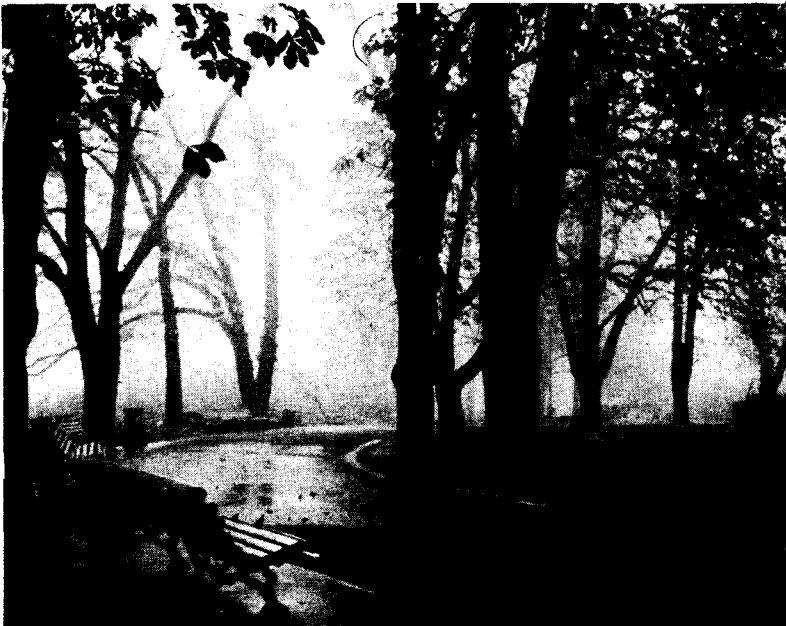
Осінній парк.

учитель Пилипівської середньої школи Фахівського району Київської області;