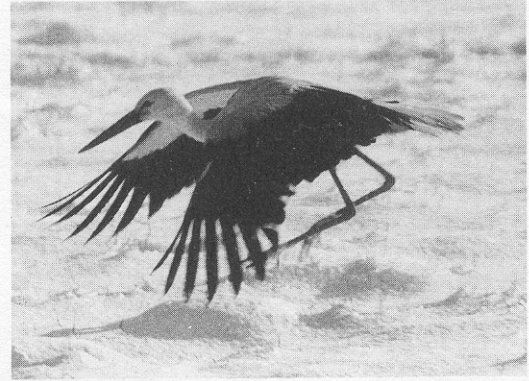
Abb. 1 Weißstorch im Schnee. Beide Abbildungen zeigen nicht den im Text behandelten Storch

252060 Kiew, Jasnogorskaja Str. 15, UdSSR