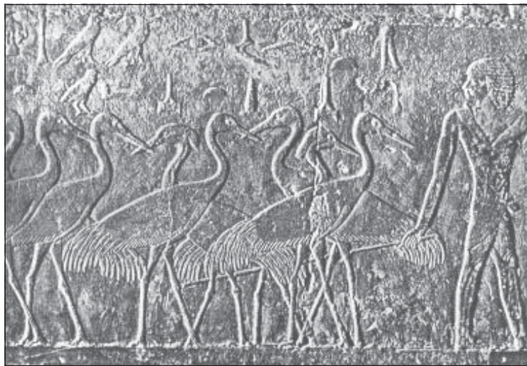
Рис. 2. Полуодомашненные серые журавли и красавки с пастухом. Гробница фараона Ти, начало 5 династии. Из: Schüz, 1966.

На египетских монетах периода Римской империи феникса, считавшегося у египтян священным, изображали в виде журавля с нимбом из лучей 1 . Журавлей и подобных им птиц можно