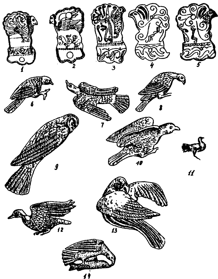
Рис.2. Изображения птиц. 1,2,4-10,13-голуби, 11-дрофа, 14-орлан