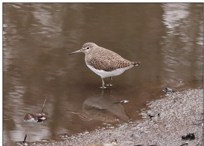
Фото 2. Лісовий коловодник на лісовому озері в околицях м. Ківерці Волинської області. 10.12.2024 р.