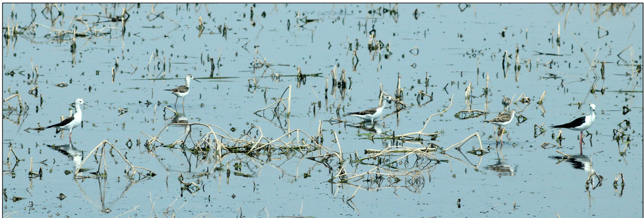
Фото 1. Дорослі довгоноги з виводком на відстійниках біля Луцька. 28.07.2019 р. Photo 1. Adult Black-winged Stilts with three young birds on filter beds near Lutsk.

Ключові слова: Західна Україна, фауна, поширення, гніздування, зимівля.