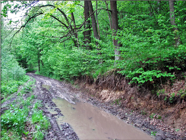
Фото 1. Місце гніздування волового очка в земляній стінці на межі нагірної діброви і вільшняка. 17.05.2009 р.