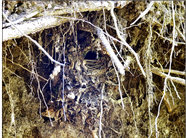
Фото 2. Гніздо волового очка у стінці крутосхилу. 3.05.2009 р.

Більше всього «самцевих» гнізд – 24 – виявлено у невисоких земляних крутосхилах, ще 4 – в підшвах ви-