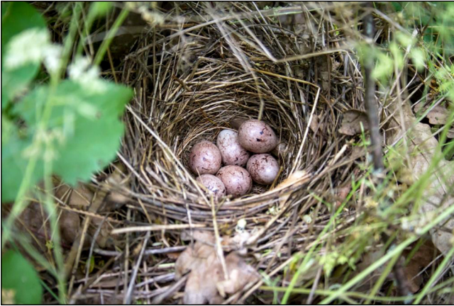
Фото 3. Гнездо обыкновенной овсянки. 26.05.2018 г., заказник «Владимировская дача». Photo 3. A nest of Yellowhammer.