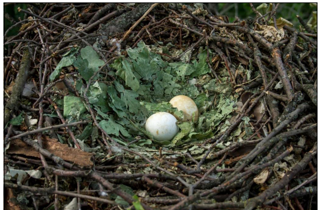
Фото 2. Гнездо орла-карлика в лесополосе. 26.05.2018 г. Photo 2. A nest of Booted Eagle in a forest belt.