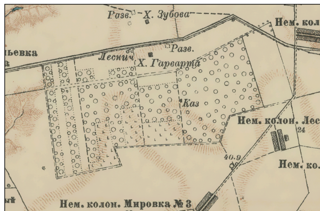
Рис. 2. Район исследований на карте-трехверстке по данным съемки 1917–1922 гг.