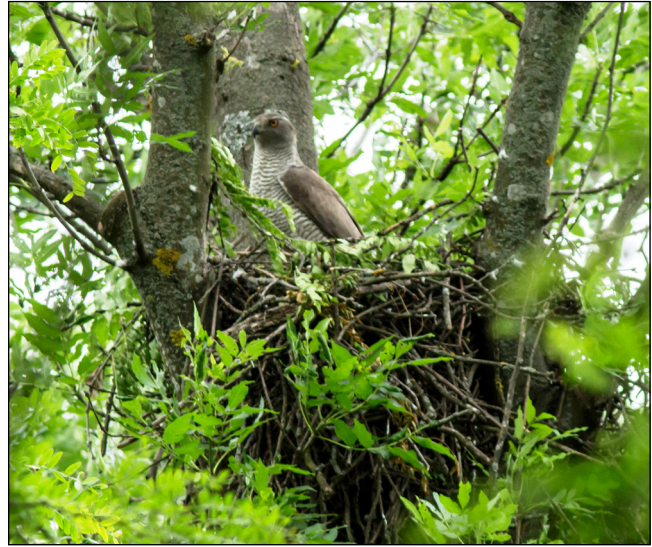
Фото 1. Гнездо тетеревятника. 26.05.2018 г., заказник «Владимировская дача».