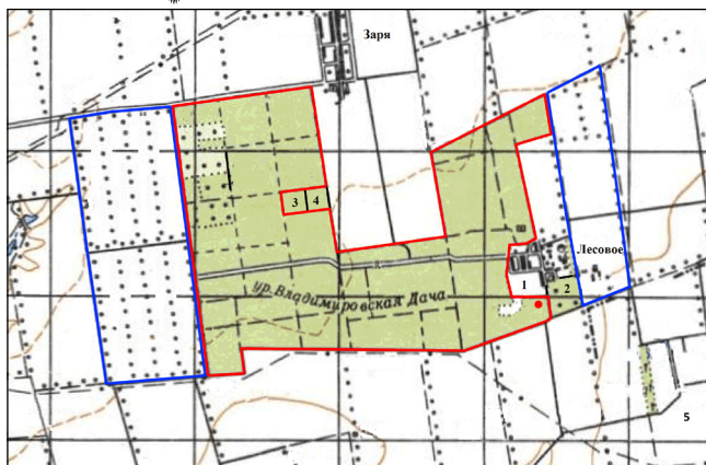
Рис. 1. Район исследований.

Красной линией выделены границы заказника «Владимировская дача». Синей линией обозначен контур расположения ПЗЛП. Другие объекты: 1 – «Степок», 2 – «Владимировский парк», 3 – «Ленинское», 4 – «Юбилейное», 5 – под. Красная точка – место стоянки и отлова птиц в 2018–2020 гг.