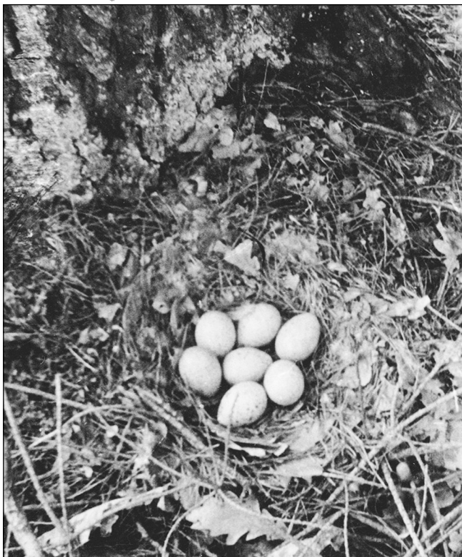
Гнездо глухаря. Окрестности с. Гамалеевка Шосткинского р-на Сумской обл., 15.05.1965 г. A nest of Capercaillie.