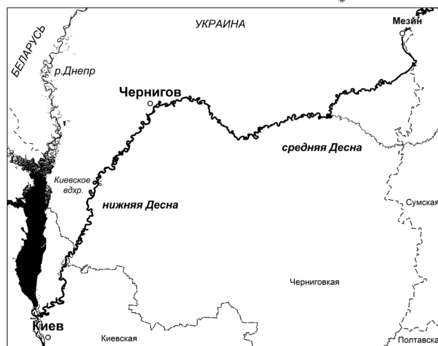
Рис. 1. Район исследований.

Отдельно следует рассмотреть огромные намытые песчаные острова и косы, образующиеся в основном под автомобильными и железнодорожными мостами через реку. Такие острова служат постоянным местом гнездования крачек и привлекают на отдых и кормежку большое количество куликов. Так, на крупной косе в окрестностях с. Воловица (Борзнянский район) 7.07.2014 г. было учтено 3 больших улита, 38 фифи, 2 малых зуйка (гнездящаяся пара), 8 перевозчиков, 4 мородунки ( Xenus cinereus ), 19 турухтанов, 14 чибисов ( Vanellus