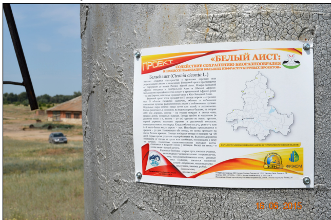
Фото 3. Информационная табличка в местах установки искусственных гнездовий (хут. Пухляковский Верхнедонского района).

Photo 3. Information plate at the locations of artificial nesting platforms.