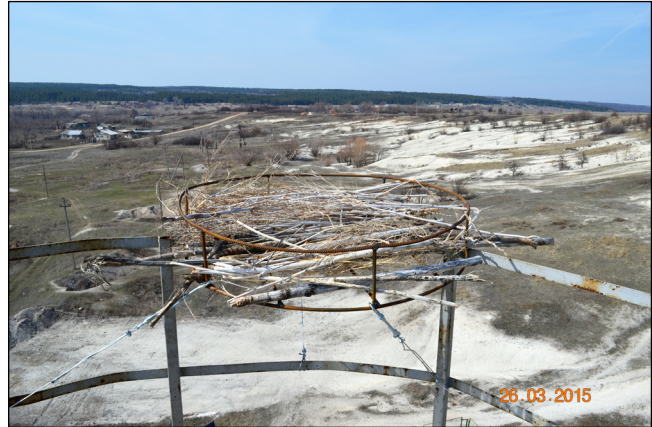
Фото 2. Общий вид и способ крепления гнездовой платформы для белого аиста на действующих водонапорных башнях.

В 2015 г. в результате выполнения данного проекта отмечено возможное начало следующей волны заселения, точнее освоения, белым аистом новых территорий. Так, в этом году отмечены новые попытки гнездования вида в Миллеровском, Обливском и Верхнедонском районах Ростовской области. Интересной особенностью является то, что все попытки гнездования были зафиксированы на столбах линий электропередачи и все они оказались безуспешными. Так, в хут. Сеньшин Обливского района птицы построили гнездо, но бросили его, не приступив к насиживанию. В хут. Криворожье Миллеровского района на одной из улиц населенного пункта две пары аистов пытались строить гнезда на столбах линий электропередач. В мае 2015 г. в хут. Нижнетиховский Верхнедонского района птицы начали строить гнездо на столбе линии электропередачи. Местные жители решили установить рядом новый столб с искусственным гнездовьем, для того чтобы спасти аистов от удара током. Но аисты не только