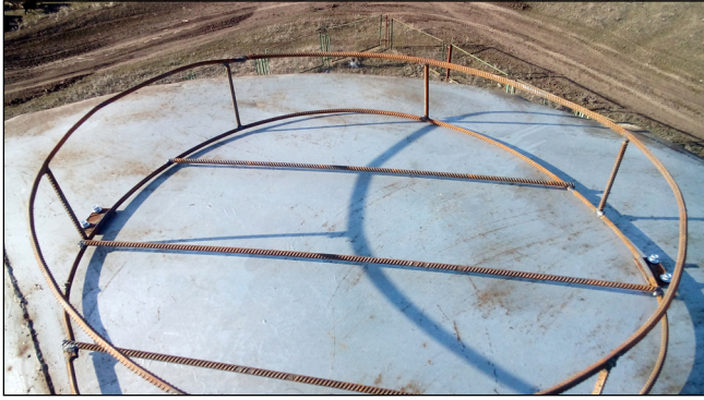
Фото 1. Общий вид и способ крепления гнездовой платформы для белого аиста на недействующих водонапорных башнях.

Photo 1. General view and method of fixing of nesting platforms for White Storks on inactive water towers.