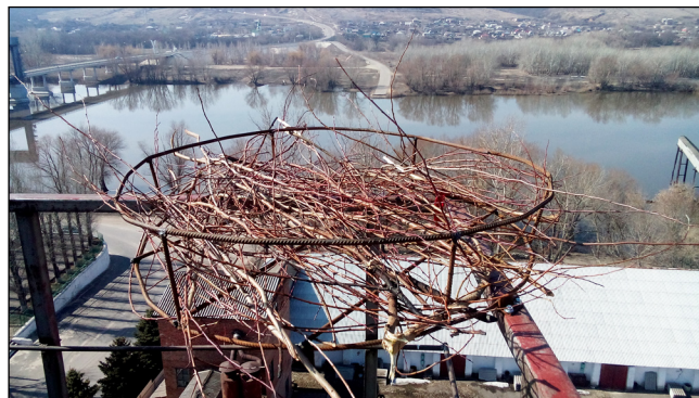
Фото 4. Гнездовая платформа на вышке сотовой связи в ст. Казанская.

Для обеспечения безопасности водоснабжения и качества поставляемой воды практически все башни Рожновского имеют ограждения и обрешетку, что будет способствовать сохранности гнездовых платформ длительное время. Установка гнездовий на водонапорных башнях имеет ряд преимуществ перед другими типами искусственных сооружений (Грищенко, 2007). Но есть и другие благоприятные факторы. Действующие водонапорные башни постоянно обслуживаются и контролируются службами водоснабжения (при снятии показаний счетчиков, хлорировании воды, заполнении емкости), что позволяет оперативно получать информацию о состоянии размещенных на башнях гнезд. Как правило, списанные башни располагаются в непосредственной близости от новых, что также позволяет получать информацию о