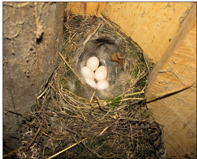
Фото 2. Гнездо чернушки в уголке под сараем. 26.04.2012 г., с. Вакаловщина.

К строительству гнезд некоторые пары приступают в первой декаде апреля (10.04.2010 г. 1 гнездо было полностью готово, но в дальнейшем птицы его оставили; прилет в этом году отмечен 25.03), массовое строительство происходит во второй половине этого месяца. Строят гнездо оба члена пары, преимущественно в утренние часы. Гнездостроительная активность у них угасает постепенно, нам известен случай, когда самец приносил соломинки к гнезду с 4-дневными птенцами. Между завершением строительства гнезда и откладкой первого яйца наблюдается определенная пауза, которая в одном случае составила 3–3,5 дня.