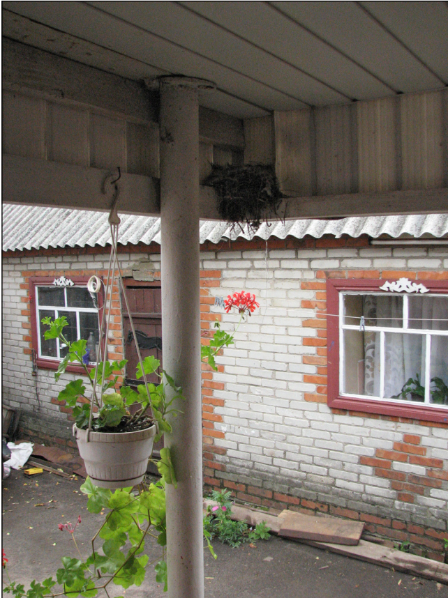
Фото 1. Гнездо чернушки под навесом крыльца. 16.07.2013 г., г. Тростянец. Photo 1. A nest of the Black Redstart under roof of a porch.

14.04.1989, 29.03.1990, 7.04.1991, 6.04.1992, 7.04.1993, 5.04.1994, 13.04.1995, 8.04.1996, 2.04.1997, 9.04.1998, 30.03.1999, 2.04.2000, 14.03.2001, 16.03.2002, 5.04.2003, 11.04.2004, 26.03.2006, 24.03.2007, 12.03.2008, 30.03.2009, 25.03.2010, 1.04.2011, 28.03.2012, 19.03.2013. Анализ этого ряда фенодат показывает, что в последние десятилетия прослеживается четкая тенденция к более раннему прилету. Так, в период с 1980 по 1990 гг. чернушки появлялись в среднем 11.04 \pm 2,8 дня ( n = 8 ), в 1991–2000 гг. – 6.04 \pm 1,3 дня ( n = 10 ), в 2001–2013 гг. – 25.03 \pm 2,6 дня ( n = 12 ). Коэффициент линейной регрессии за весь период наблюдений составляет -0,70 ( n = 30 , p < 0,001 ).