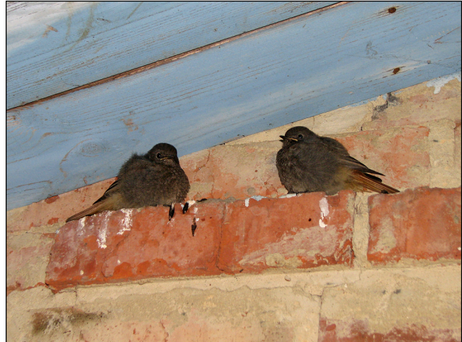
Фото 5. Молодые чернушки на ночевке. 30.07.2013 г., с. Вакаловщина. Photo 5. Young Black Redstarts on a roosting place.

из них (5-й к тому времени уже погиб от холода и недокорма) вечером подложили к птенцам большой синицы ( Parus major ), завершилась провалом – на следующий день синицы устранили подкидышей из гнезда.