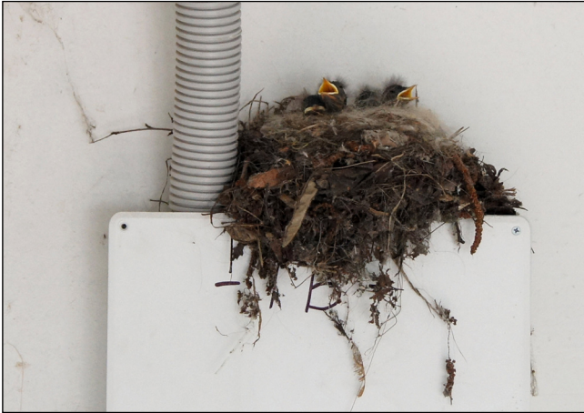
Фото 3. Гнездо чернушки на коробке кабельного ТВ. 2.07.2012 г., г. Сумы. Photo 3. A nest of the Black Redstart on a box of cable TV.

Сроки откладки яиц у горихвостки-чернушки в Сумской области растянуты на 2,5 месяца – с середины апреля до конца июня, что четко отражает два репродуктивных цикла (рис. 1), свойственные данному виду.