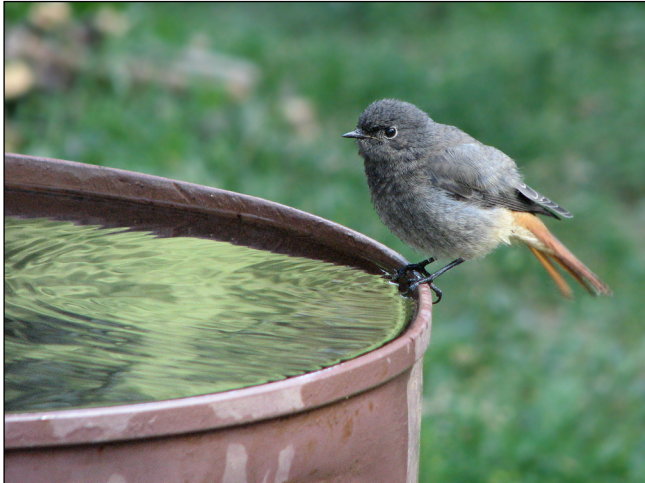
Фото 4. Молодая чернушка на водопое. 24.06.2013 г., с. Вакаловщина. Photo 4. A young Black Redstart on a watering place.