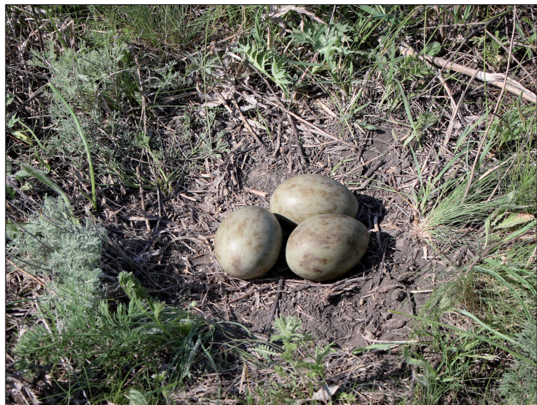
Фото 3. Гніздо дрохви. Керченський п-ів, 5.05.2010 р. Photo 3. A nest of Great Bustard, Kerch peninsula.

Довгоніг ( Himantopus himantopus ). 3.05.2010 р. пролітав над перелісками на Олешківських пісках південніше с. Козачі