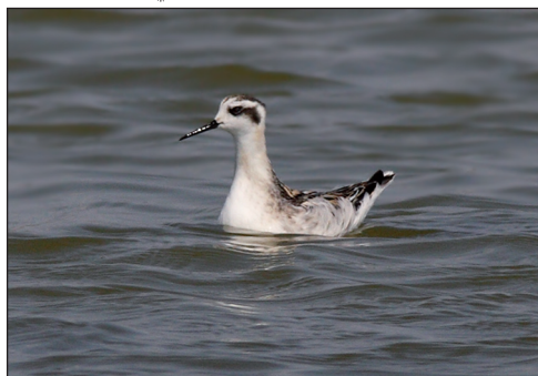
Фото 4. Круглодзьобий плавунець. Пересип Тилігульського лиману. 25.08.2009 р. Photo 4. A Red-necked Phalarope at the Tiligul Liman.

Лагері Цюрупинського району Херсонської області.