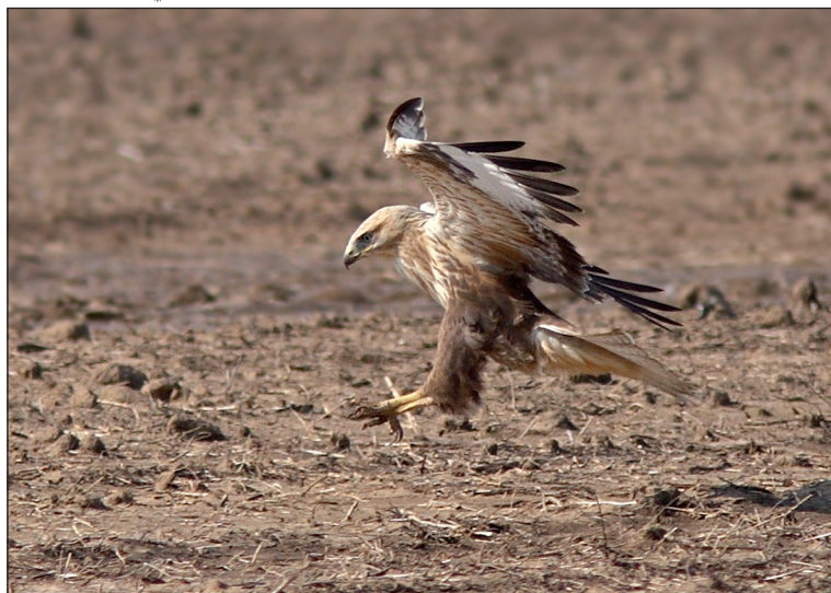
Фото 2. Степовий канюк. Околиці с. Чайкине АР Крим. 2.10.2009 р. Photo 2. A Long-legged Buzzard in the Crimea.

Мисове Джанкойського району АР Крим (фото 2).