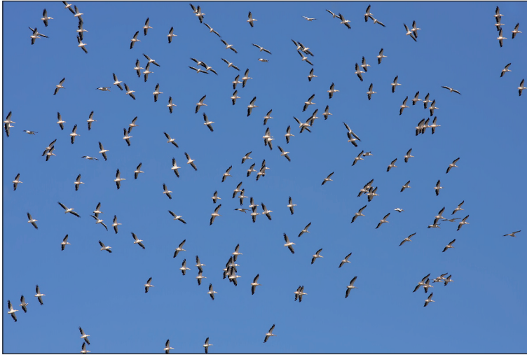
Фото 1. Зграя рожевих пеліканів. П-ів Тюп-Тархан, АР Крим. 5.08.2011 р.

Photo 1. A flock of White Pelicans in NE of the Crimea.