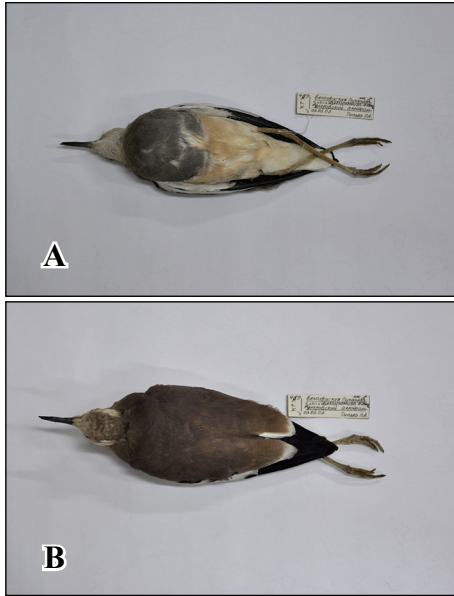
Фото 2. Колекційна шкурка белохвостой пугалицы из фондов Сочинского национального парка: А – вид снизу, В – вид сверху.

Photo 2. Skin of White-tailed Lapwing from the collection of the Sochi National Park: А – underside view, В – view from above.