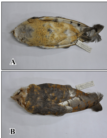
Фото 3. Коллекционная шкурка сипухи из фондов Сочи́нского национального парка: А – вид снизу, В – вид сверху. Photo 3. Skin of Barn Owl from the collection of the Sochi National Park: А – underside view, В – view from above.

1. ННПМ. № 28718/91. Российская Федерация, Краснодарский кр., Анапский р-н, окр. ст-цы Благовещенская, Кизилташская коса. Самец. 1.05.1975 г. П.А. Тильба.