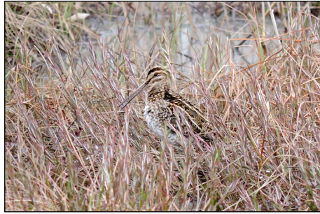
Фото 1. Бекас у заказнику «Дідове озеро». 14.04.2018 р.

(Тхоринське лісництво, кв. 82 та 73). В цей же день один птах токував у сосновому лісі на північний захід від цього населеного пункту (Сирницьке лісництво, кв. 24). Також чули токування на узліссі та бачили двох птахів поряд на городах біля с. Бігунь. 12.05.2021 р. трьох синяків спостерігали в сосновому лісі західніше с. Кованка в межах заказника «Словечанський кряж» (Кованське лісництво, кв. 3). 13.05.2021 р. в соснових лісах південніше та західніше с. Дуби тричі реєстрували