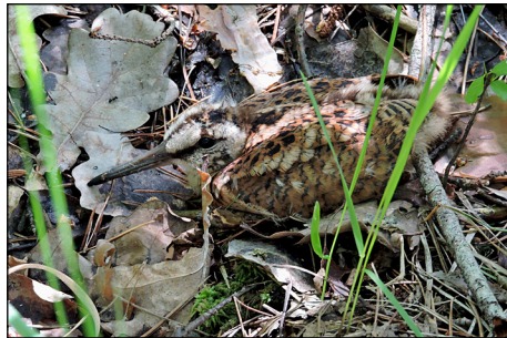
Фото 2. Пташеня вальдшнепа. Сирницьке лісництво. 17.05.2018 р.

Photo 2. A fledgling of the Eurasian Woodcock.