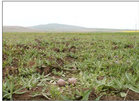
Фото. 2. Гнездо красавки на заброшенном поле. 22.04.2006 г., северо-восточное подножье г. Карпина.