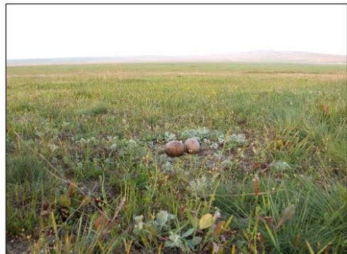
Фото. 3. Гнездо красавки на остепненном лугу, 21.04.2006 г., южное подножье г. Карпина.

Мы регистрировали авдотку только один раз – две птицы (идентифицированы по голосу) кричали ночью 22.04.2006 между железнодорожным полотном и северо-западной подошвой г. Карabetова. Осмотр биотопов г. Карabetова, включающих участки с сильно разреженным, угнетенным травостоем или полностью лишенные рас-