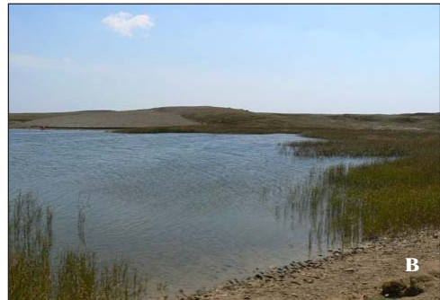
Фото. 1. Биотопы г. Карабетова: а) степной склон под выпасом, б) солонцы, в) пресное озеро. 22.04 и 30.07.2006 г.